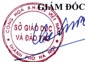
Trần Thế Cường