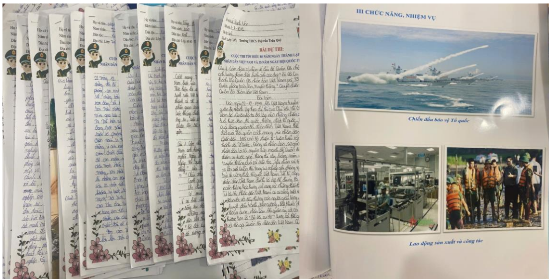
( Cuộc thi thu hút đông đảo học sinh nhà trường tham gia )

Cuộc thi đã thực sự trở thành một phong trào sôi nổi, thu hút sự tham gia nhiệt tình của các em học sinh. Từng bài dự thi là minh chứng cho tài năng, sự sáng tạo và lòng yêu nước của học sinh Trường THCS TT Trâu Quy. Đây không chỉ là sân chơi trí tuệ mà còn là dịp để các em thể hiện tình cảm, lòng kính trọng đối với Quân đội Nhân dân Việt Nam và những người lính đã hy sinh vì độc lập, tự do của Tổ quốc.