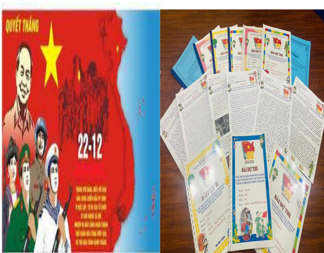
(Các bài dự thi hướng về Ngày thành lập Quân đội nhân dân Việt Nam)

19/09/2024). Cuộc thi là cơ hội để các em tìm hiểu sâu hơn về truyền thống yêu nước, lòng dũng cảm và tinh thần bất khuất của Quân đội Nhân dân Việt Nam. Qua đó, giúp các em hiểu rõ hơn về trách nhiệm của thế hệ trẻ trong việc tiếp nối truyền thống, góp phần xây dựng và bảo vệ Tổ quốc.