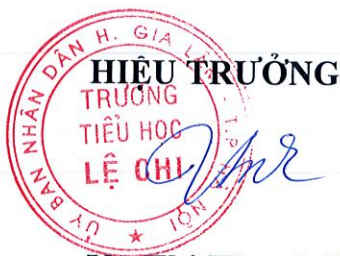
Vũ Thị Thanh Nhân

Biên bản lập xong vào hồi 16 h 30 ngày 22/4/2023, đã được thông qua các thành phần cùng nghe và nhất trí 100%