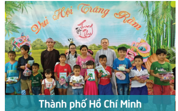
Thành phố Hồ Chí Minh