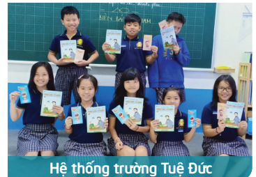
Hệ thống trường Tuệ Đức