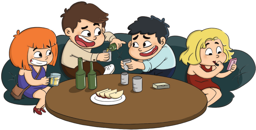
Kinh doanh quán bar, vũ trường