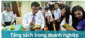
Tặng sách trong doanh nghiệp