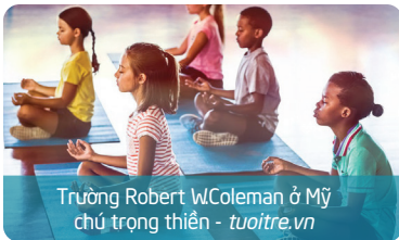
Trường Robert W.Coleman ở Mỹ chú trọng thiền