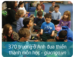
370 trường ở Anh đưa thiền thành môn học - giacngo.vn