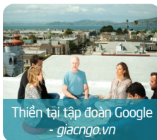
Thiền tập tập đoàn Google - giacngo.vn