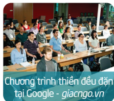
Chương trình thiền đều đặn tại Google - giacngo.vn