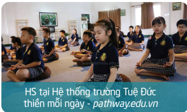
HS tại Hệ thống trường Tuệ Đức thiền mỗi ngày - pathway.edu.vn