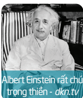
Albert Einstein rất chú trọng thiền