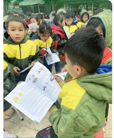
Cao Bằng, Lào Cai, Tuyên Quang