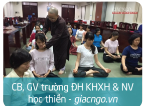
CB, GV trường ĐH KH&H & NV học thiền - giacngo.vn