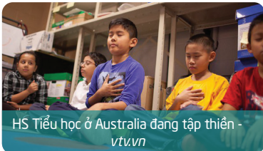
HS Tiểu học ở Australia đang tập thiền - vtv.vn