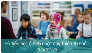
HS tiểu học ở Anh được dạy thiền từ nhỏ - tuoitre.vn