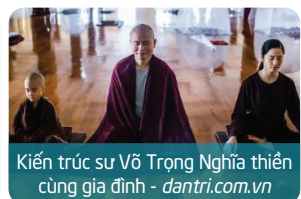
Kiến trúc sư Võ Trọng Nghĩa thiền cùng gia đình