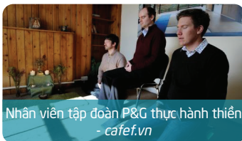
Nhân viên tập đoàn P&G thực hành thiền - cafe.vn