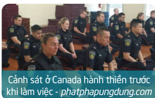
Cảnh sát ở Canada hành thiền trước khi làm việc - phatphapungdung.com