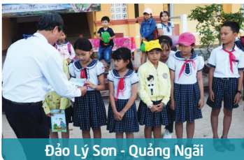
Đảo Lý Sơn - Quảng Ngãi