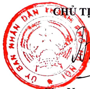
Chu Ngọc Anh